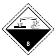
RÓTULO DE RISCO PRINCIPAL